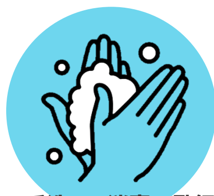
手洗い・消毒の励行