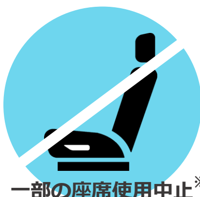
一部の座席使用中止※