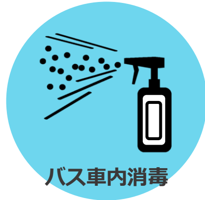
バス車内消毒 作業実施