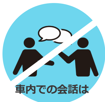
車内での会話は 控えめに