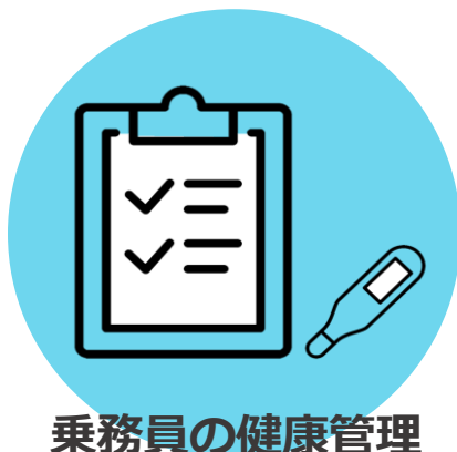
乗務員の健康管理