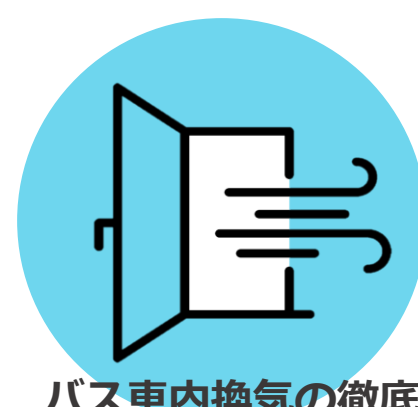
バス車内換気の徹底