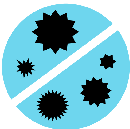
バス車内抗菌加工実施